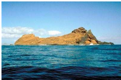
Roque del Este